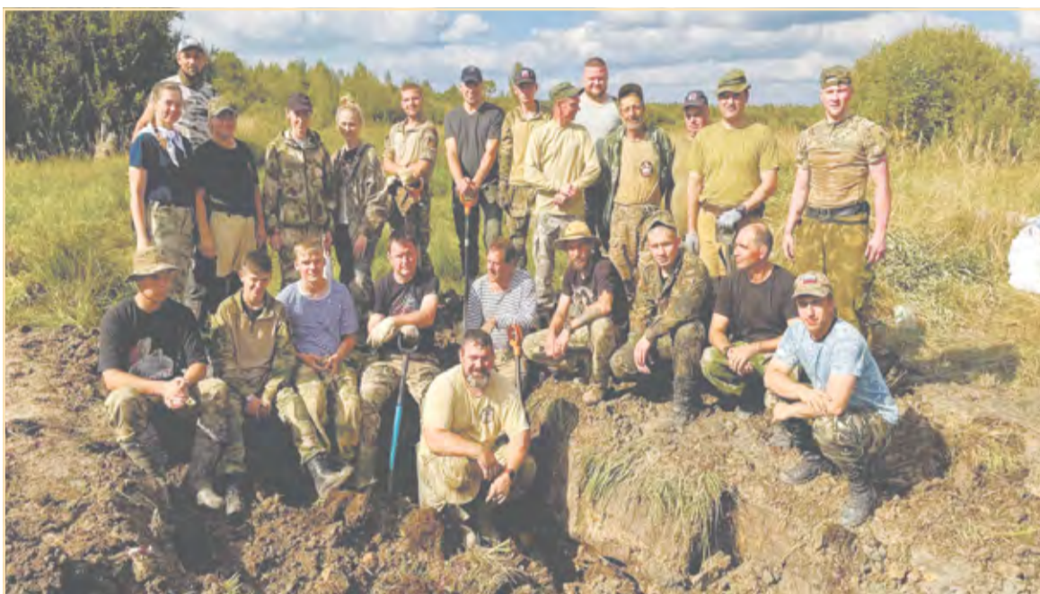
Команда поискового отряда «Пионер»

скольким павшим воинам он посвящен, то историки и краеведы до сих пор не могут прийти к общим цифрам: наряду с убитыми очень уж много раненых подо Ржевом солдат умирало не только на поле боя, но и в госпиталях. А хоронили павших и