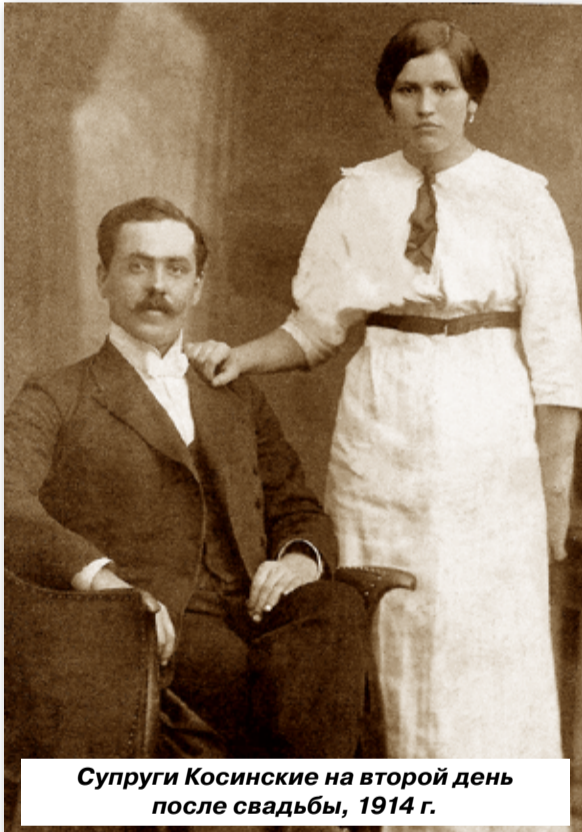
Супруги Косинские на второй день после свадьбы, 1914 г.

В 1920 г. в сане священника отец нашей главной героини принял службу в Троицком храме с.Заворово. Там же, судя по