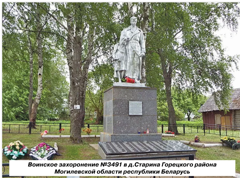
Воинское захоронение №3491 в д.Старина Горецкого района Могилевской области республики Беларусь

Однако, трудно поверить, что девушка, которой не исполнилось 18 лет, сразу попала на передовую. Хотя после огромных