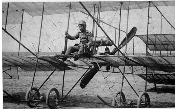
штабс-капитан Н.В.Кокаев за штурвалом “Фармана-4”. Оттиск в правом нижнем углу – Мазур 1912.

серьезных аварий! Однако, назначенный командиром 13-го отряда 5-й (Бронницкой) роты оказался не на высоте. Оправдывает его то, что он был назначен лишь 2 марта 1914 г. и успел налетать около 30 часов до выхода на фронт. Но он, оторванный от 5-й роты, совершенно потерялся и не сделал почти ни одного вылета на разведку. Два полета от Варшавы до Ново-Минска и обратно (28 сентября и 2 октября 1914 г.) ничего не решали. 4-го октября 1914 года Николай Кокаев был снят с должности