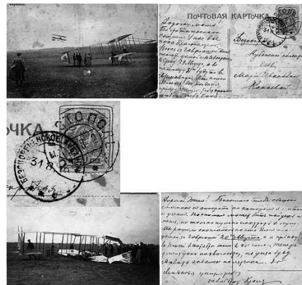
фотография, предположительно сделанная во время самих экзаменов, датированная 1912 годом